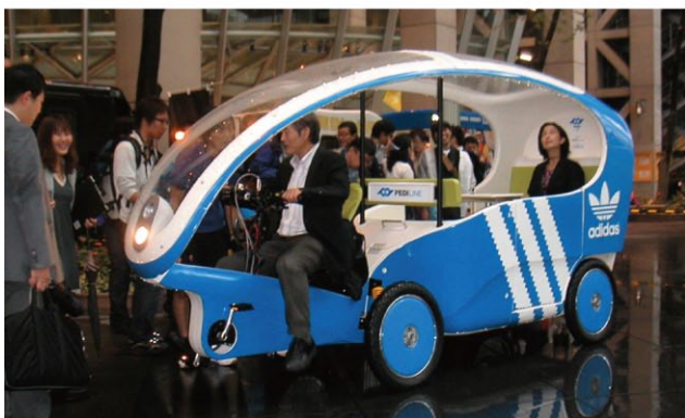
プレス向け発表会の様子