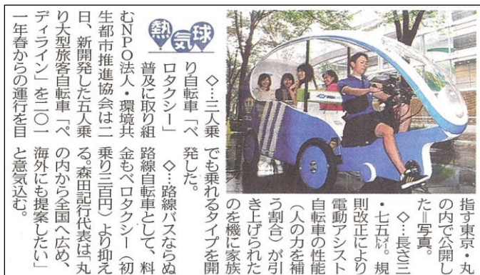
東京新聞記事より