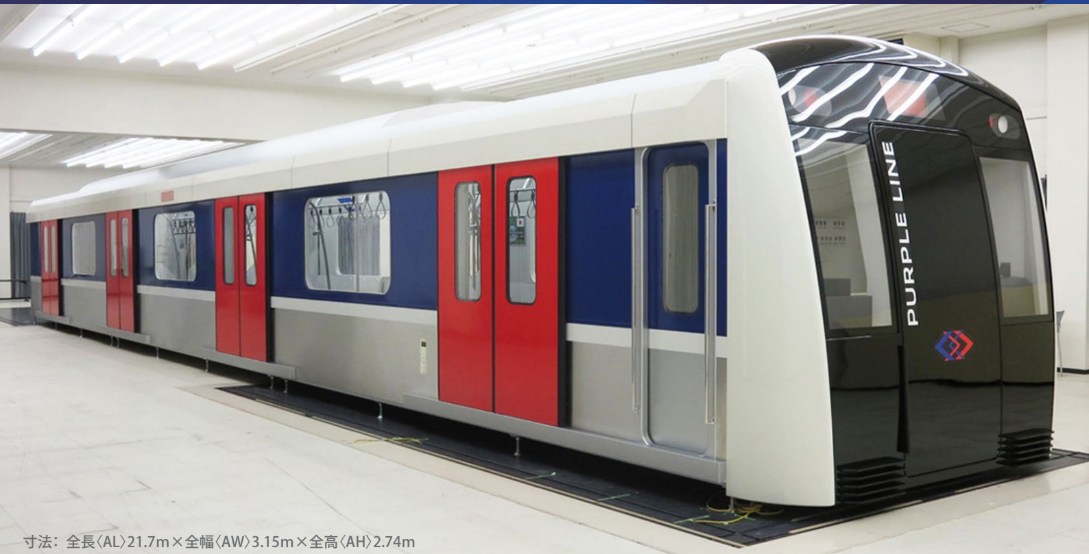
寸法：全長(AL)21.7m×全幅(AW)3.15m×全高(AH)2.74m